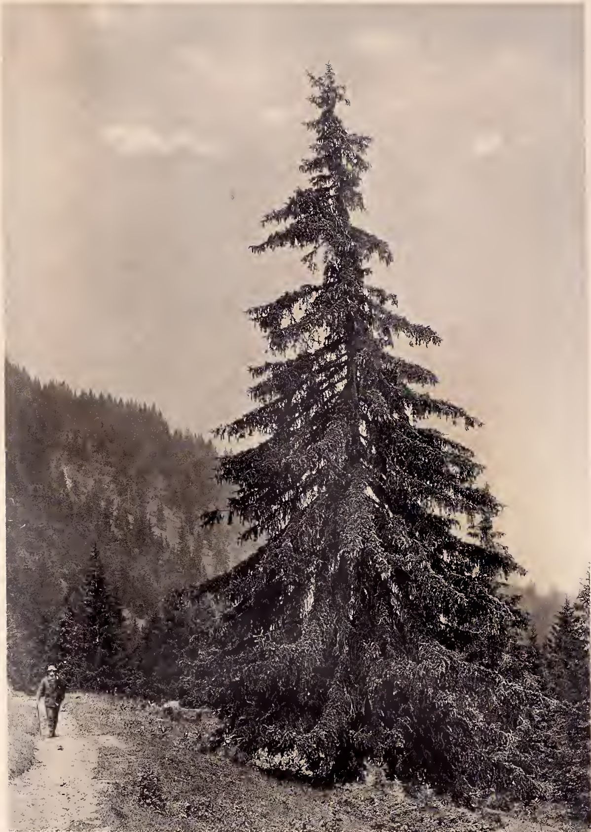
Lichtdruck: Polygraphisches Institut A.-G., Zürich